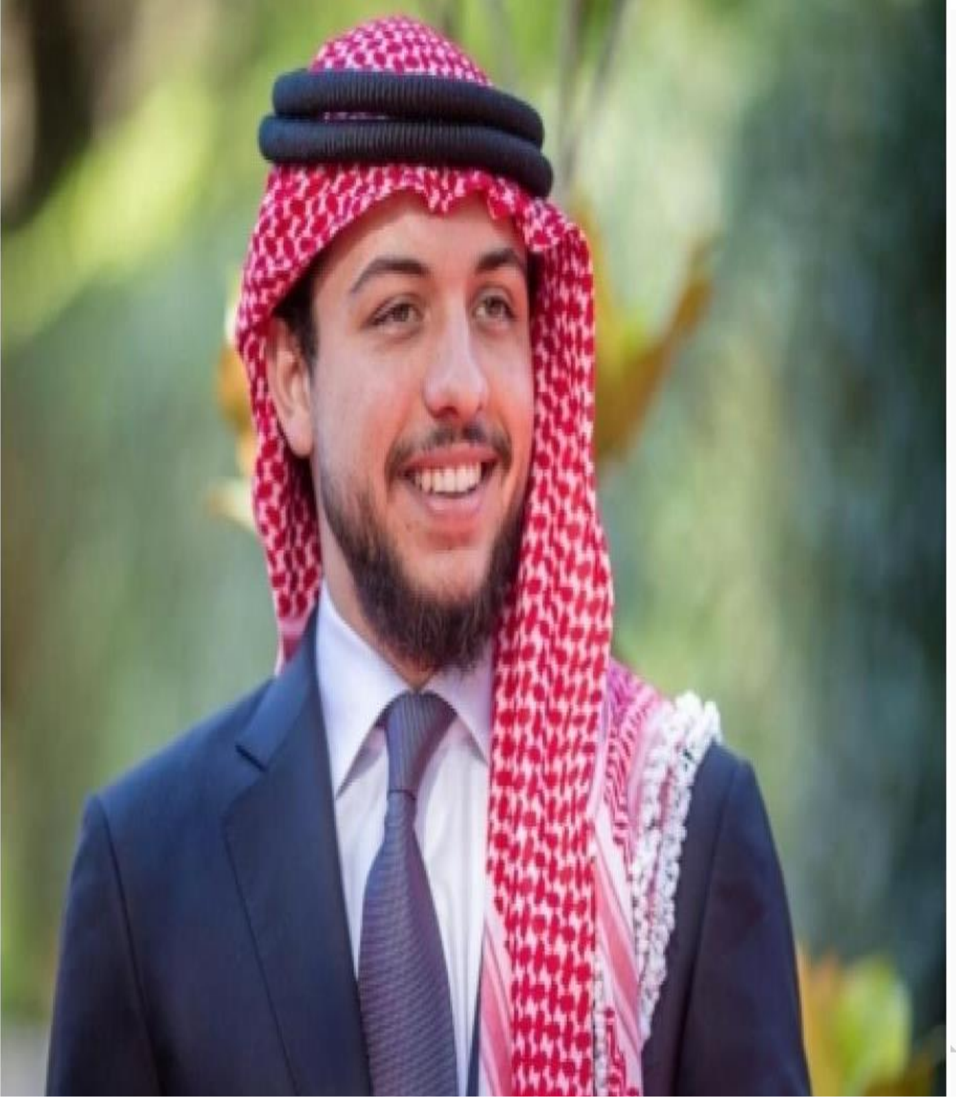
حضرة صاحب السمو الملكي الأمير الحسين بن عبد الله الثاني ولي العهد حفظة الله ورعاه