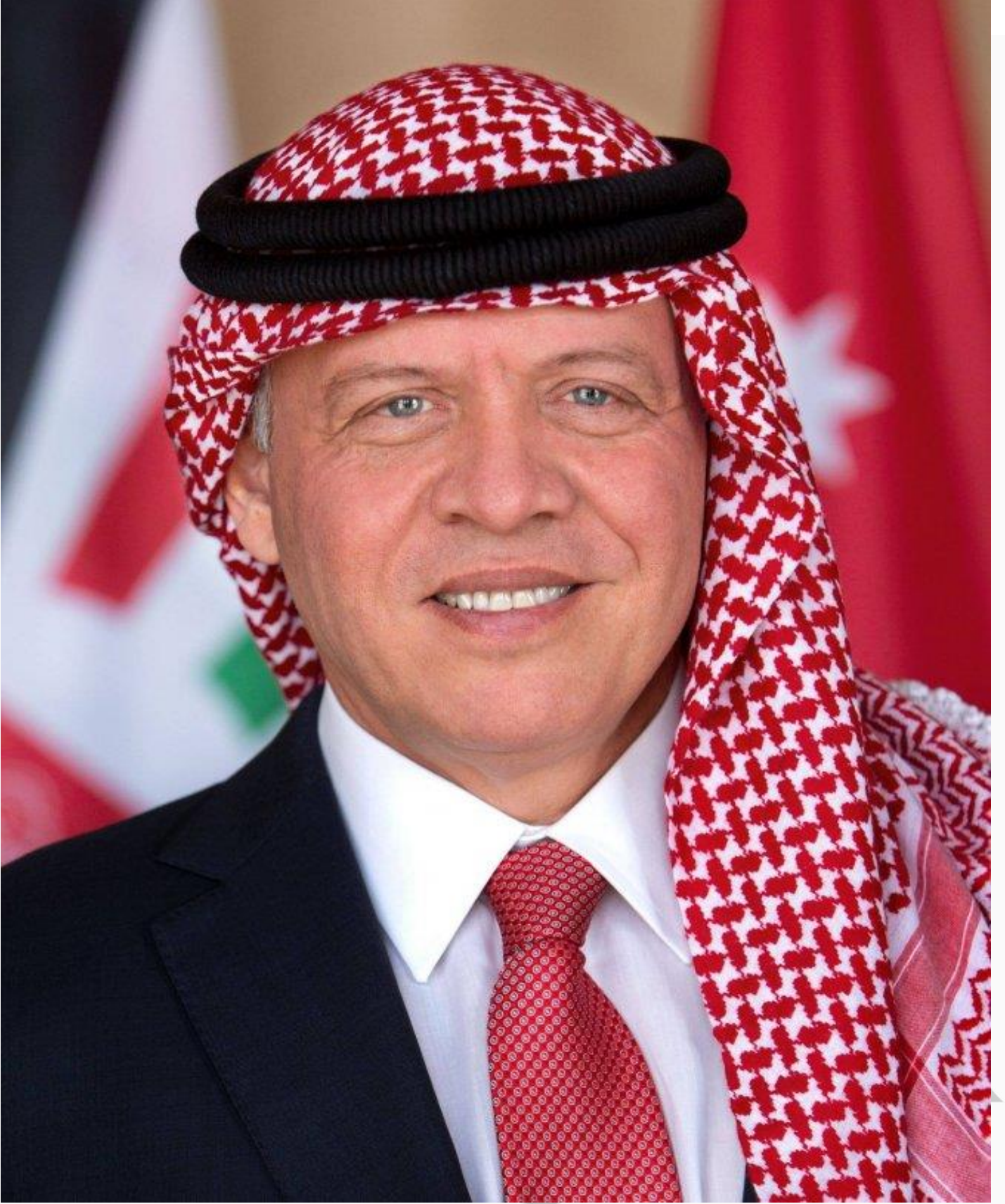
حضرة صاحب الجلالة الهاشمية الملك عبد الله الثاني ابن الحسين المعظم